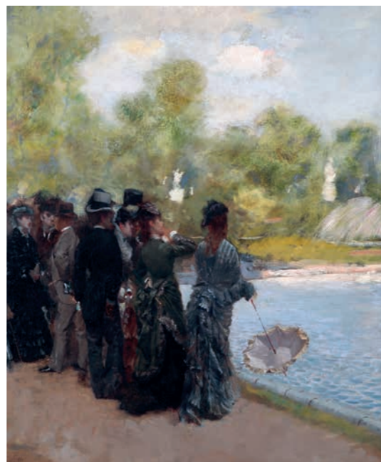
Giuseppe De Nittis, Accanto al laghetto