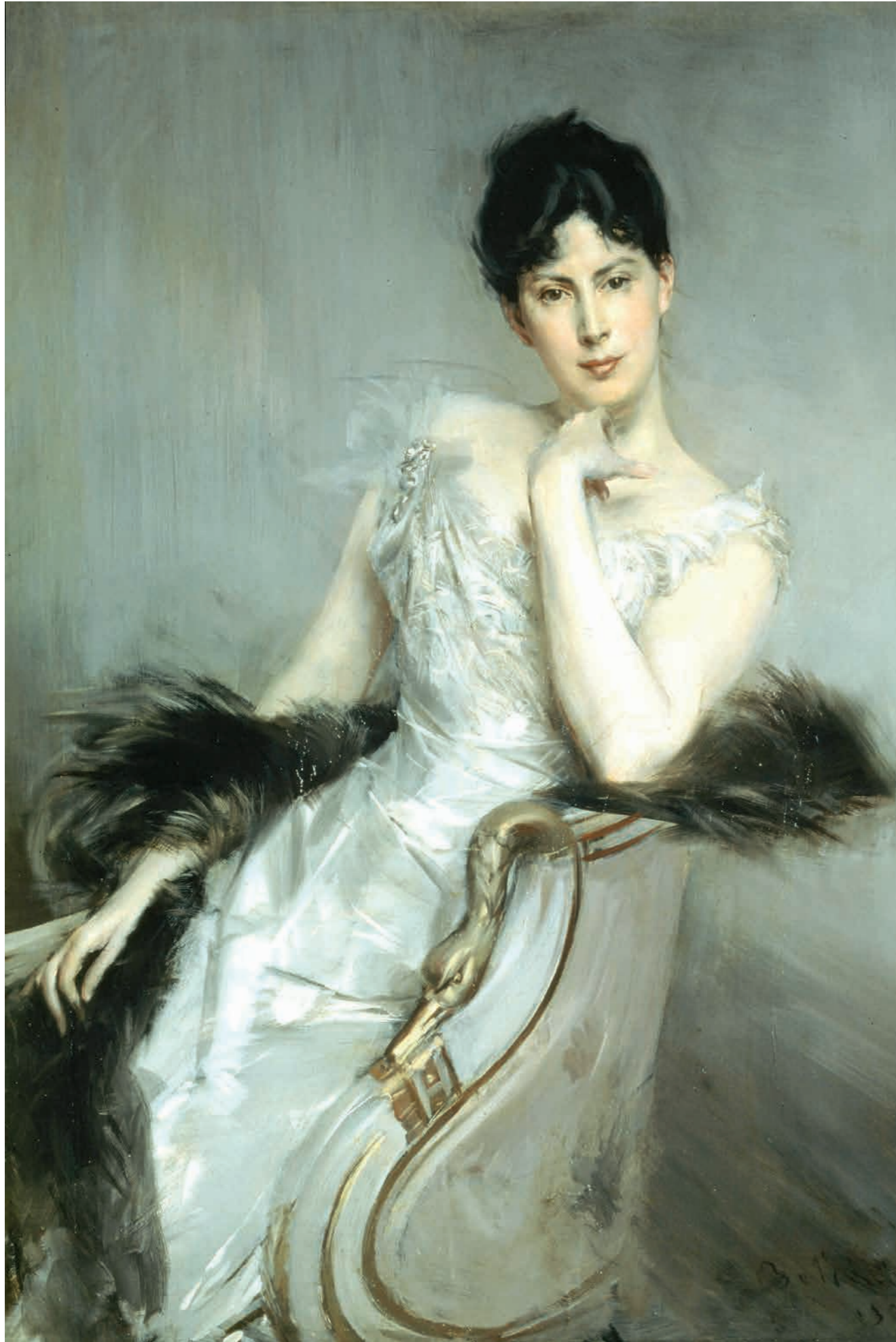
Giovanni Boldini, Signora in bianco