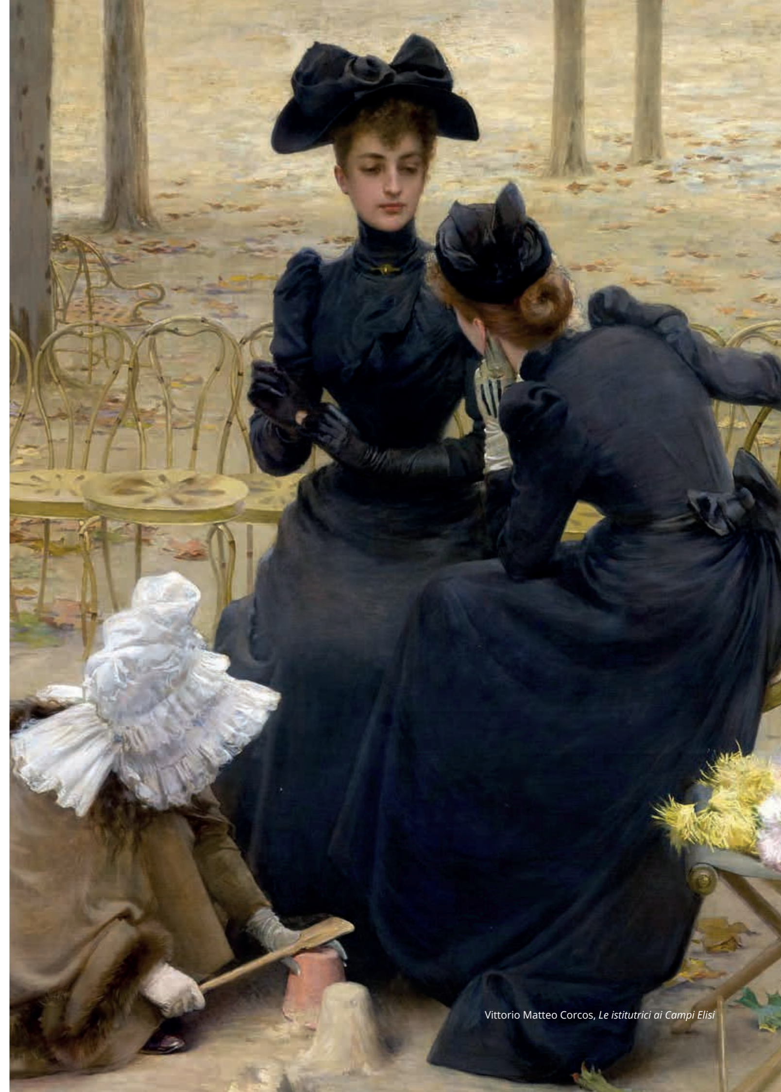
Vittorio Matteo Corcos, Le istitutrici ai Campi Elisi

L'addetto del centro prenotazioni vi confermerà la vostra prenotazione o, nel caso il calendario fosse già al completo, vi proporrà date e orari alternativi.