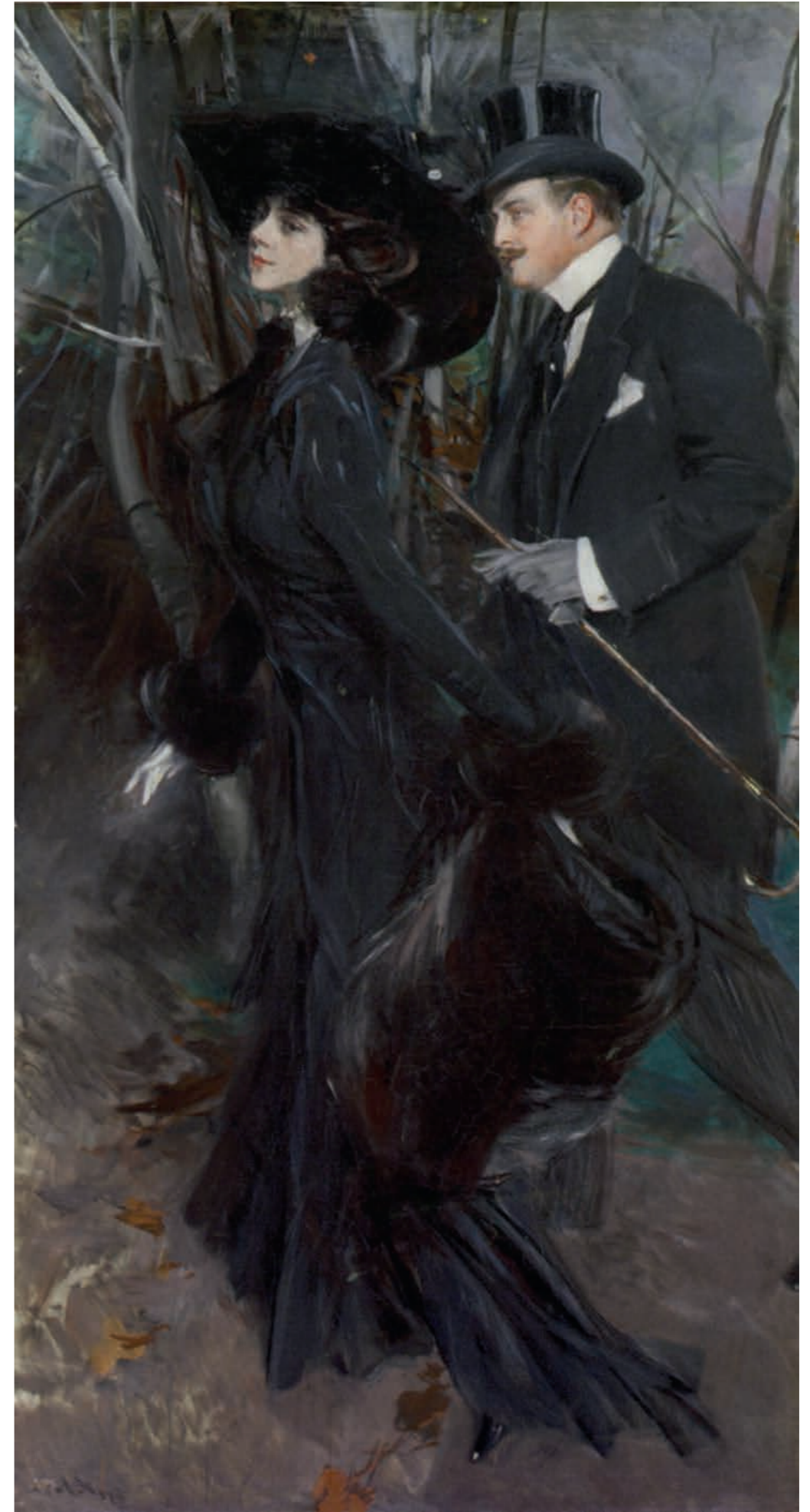
Giovanni Boldini, La passeggiata al Bois de Boulogne