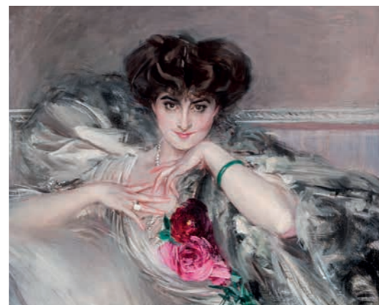
Giovanni Boldini, La principessa Raditzwill