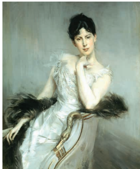
Giovanni Boldini, Ritratto di signora in bianco

Oltre a celebri dipinti quali il " Ritratto di signora in bianco " di Giovanni Boldini, " Sulla panchina agli Champs Élysées " di Giuseppe De Nittis e " Al Café Nouvelle Athènes " di Federico Zandomeneghi, sarà possibile immergersi nel clima artistico e culturale della Belle Époque grazie alla selezione di elegantissimi abiti femminili realizzati negli atelier dei sarti parigini più famosi, che divennero luoghi di ritrovo esclusivi dell'alta società; di coloratissimi manifesti - le cosiddette affiches - che pubblicizzavano i locali alla moda, cabaret, café chantant , spettacoli teatrali e grandi magazzini, disegnati da insigni illustratori come Cappiello,