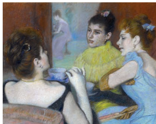
Federico Zandomeneghi, Il tè in un interno