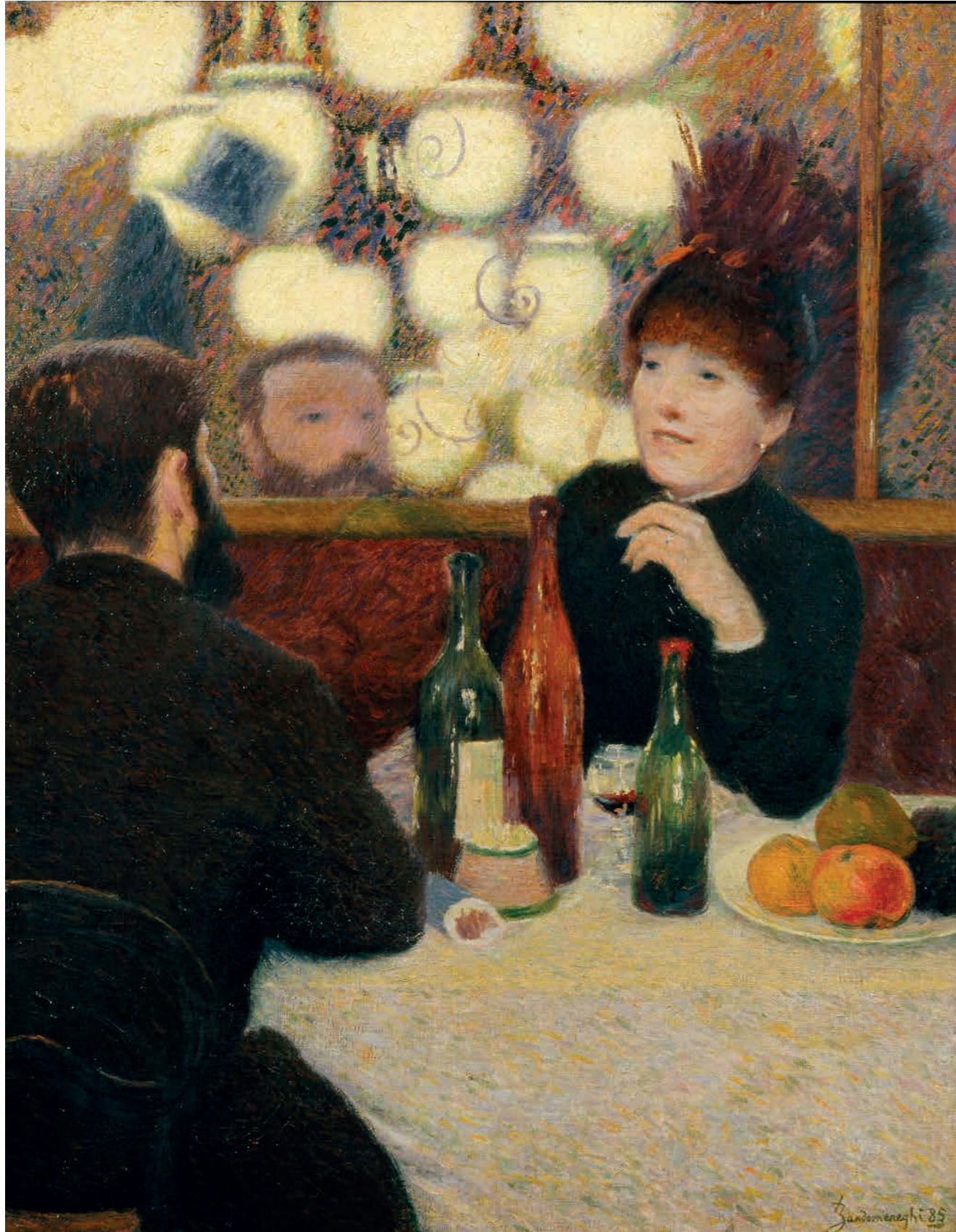
Federico Zandomenighi, Café Nouvelle Athènes