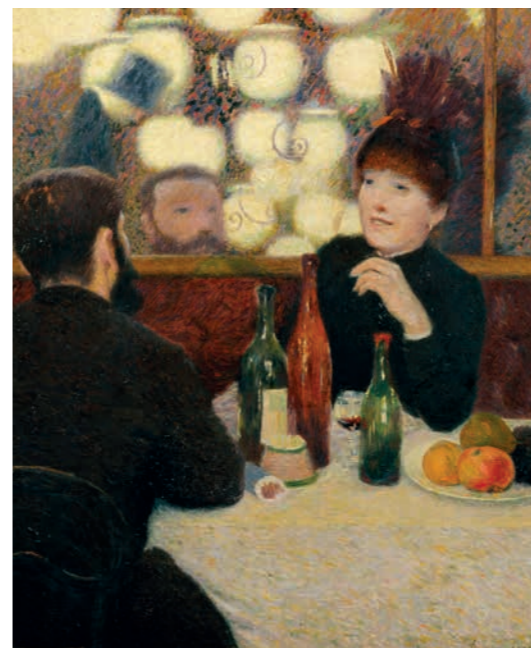
Federico Zandomeneghi, Café Nouvelle Athènes

Dudovich e Metlicovitz; e di raffinatissimi vetri artistici dai decori ispirati alla natura, impreziositi da smalti, dorature e incisioni, realizzati da Emile Gallé e dai fratelli Daum per arredare le case della ricca borghesia.