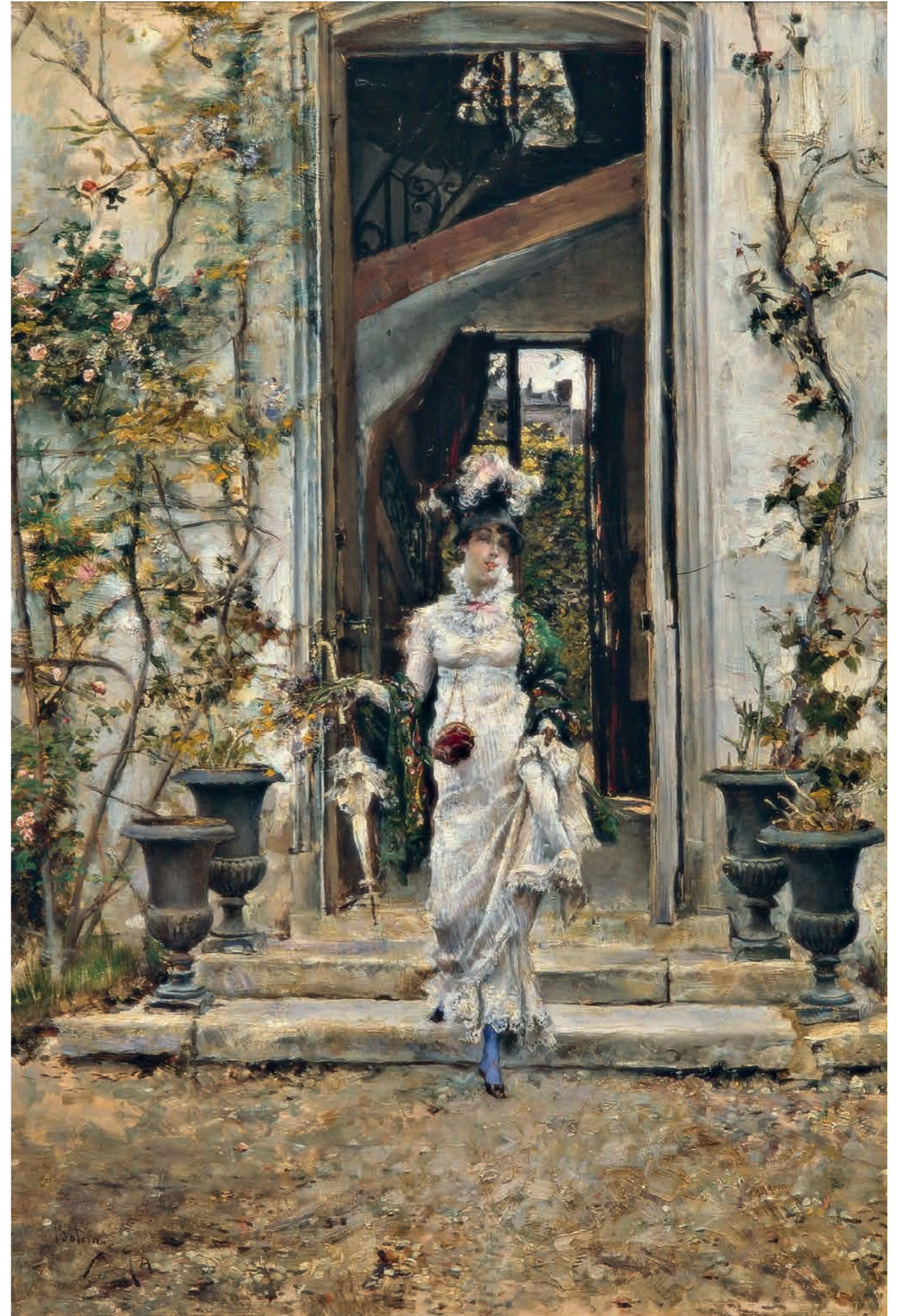
Boldini, Berthe esce per la passeggiata