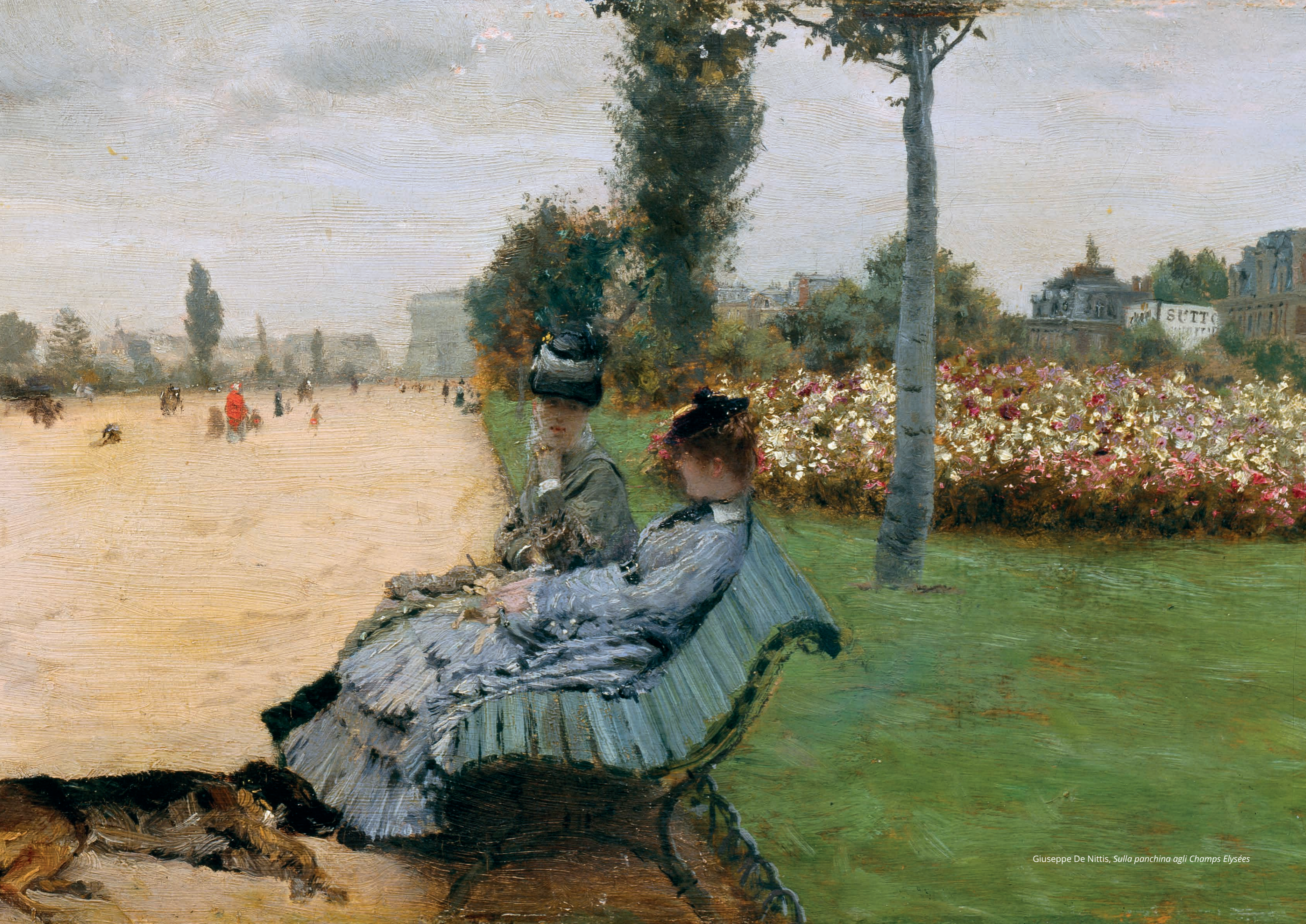
Giuseppe De Nittis, Sulla panchina agli Champs Elysées