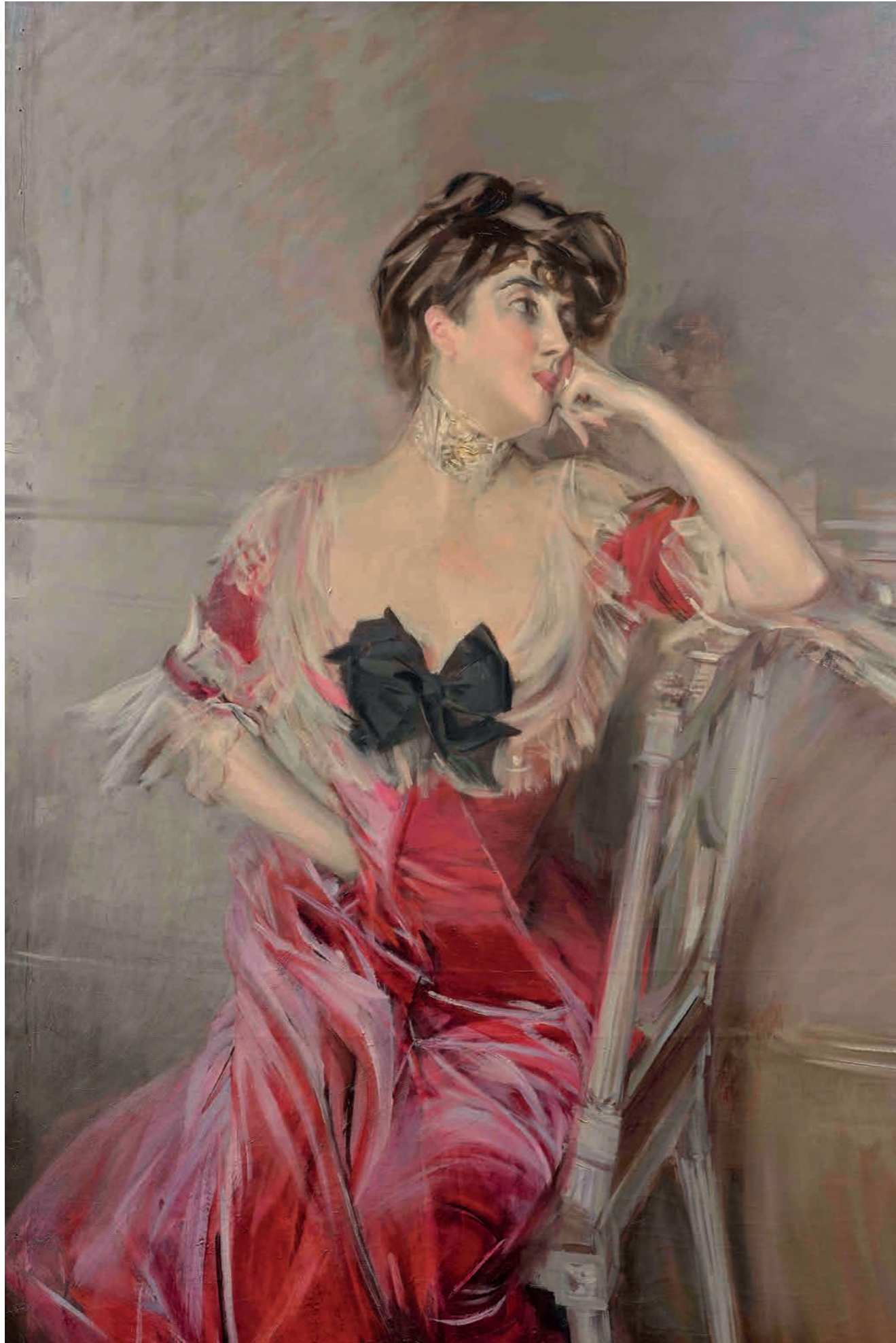
Giovanni Boldini, Ritratto di Miss Bell