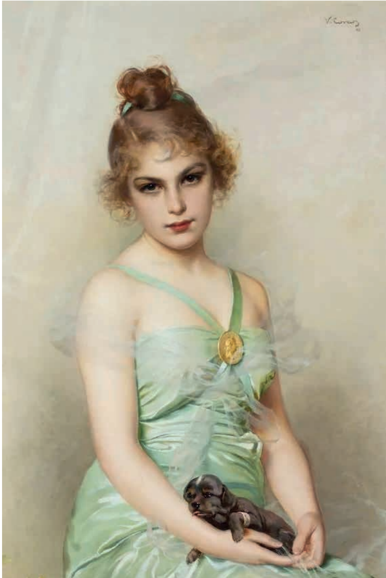
Vittorio Corcos, Neron blessé