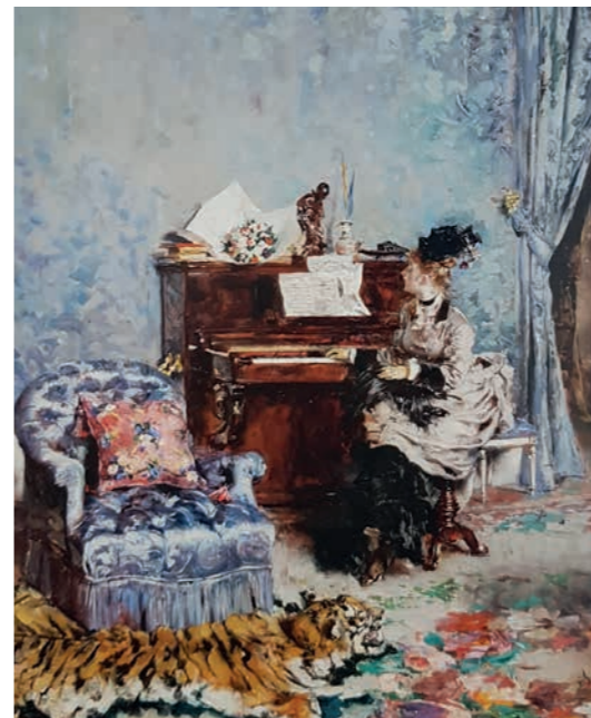
Giovanni Boldini, Signora al pianoforte