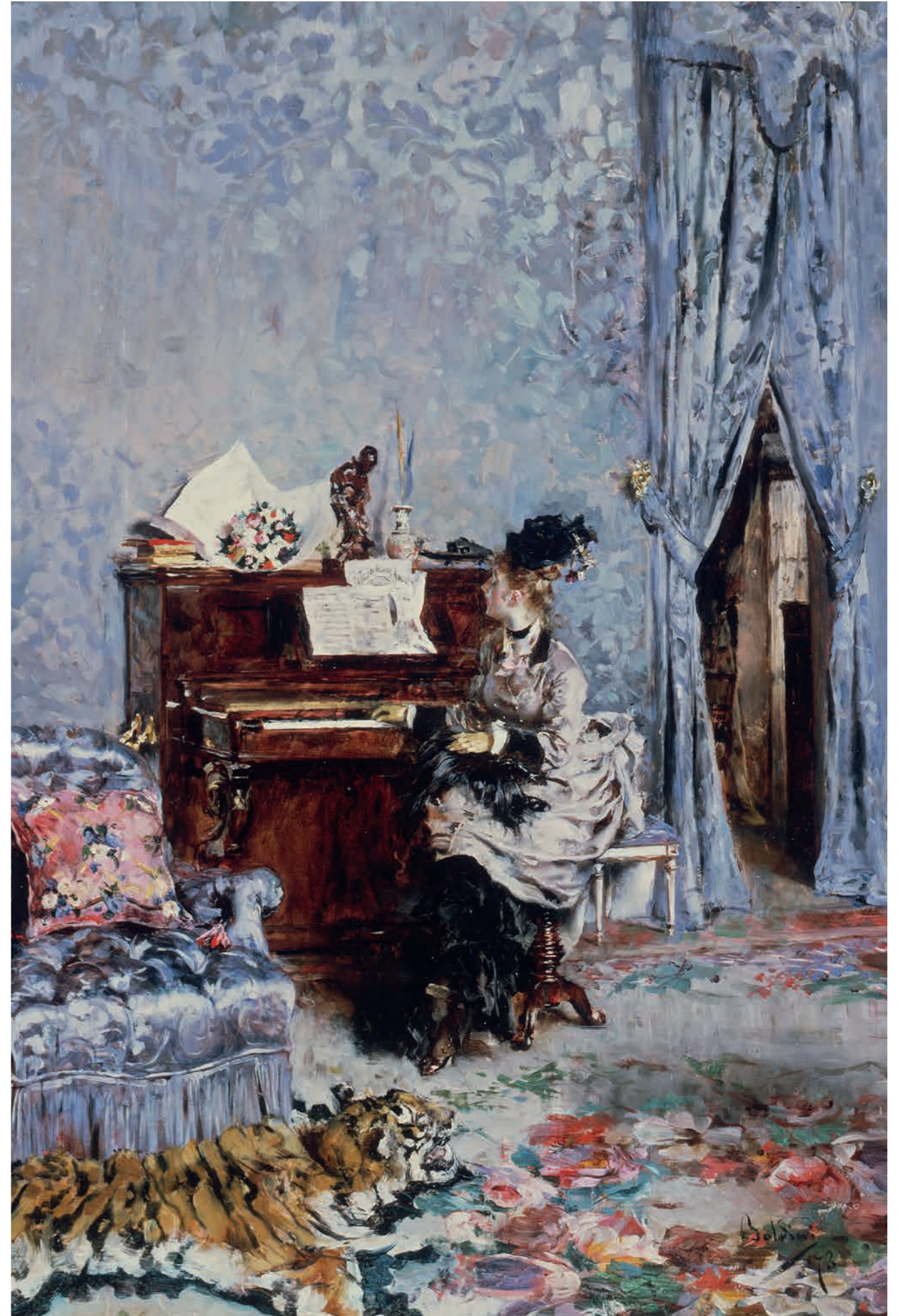
Giovanni Boldini, Signora al pianoforte